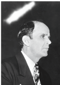
William Marrion Branham: Um Profeta Enviado por Deus

“Por meio de um profeta, o Senhor fez subir Israel do Egito, e por um profeta foi ele guardado.” Oséias 12.13