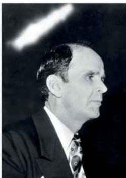
William Marrion Branham: Um Profeta Enviado por Deus

“Por meio de um profeta, o Senhor fez subir Israel do Egito, e por um profeta foi ele guardado.” Oséias 12.13