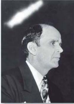
William Marrion Branham: Um Profeta Enviado por Deus

“Por meio de um profeta, o Senhor fez subir Israel do Egito, e por um profeta foi ele guardado.” Oséias 12.13