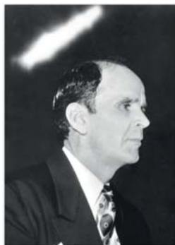
William Marrion Branham: Um Profeta Enviado por Deus

“Por meio de um profeta, o Senhor fez subir Israel do Egito, e por um profeta foi ele guardado.” Oséias 12.13